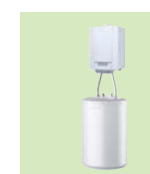
EMC-M / BS 80

Kotel V 55,4 cm Š 36,8 cm H 36,4 cm 81 kg