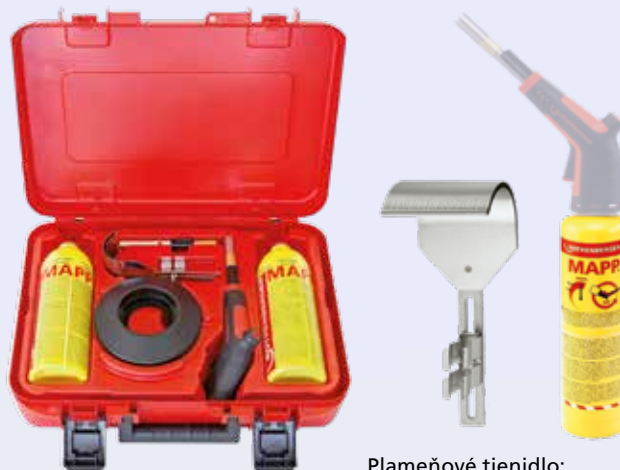
Plameňové tienidlo: chráni a zosiluje účinok