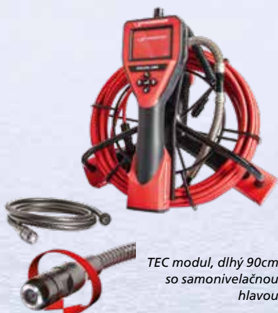
TEC modul, dlhý 90cm so samonivelačnou hlavou